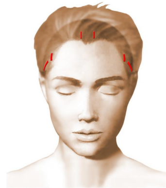
Incisions = cicatrices

Elles font entre 5 et 10 mm, sont au nombre de trois à cinq, et sont placées dans le cuir chevelu, quelques centimètres en arrière de la lisière des cheveux du front. L'une d'elles permettra le passage de l'endoscope relié à une mini caméra-vidéo, les autres livrent passage aux différents instruments spécifiquement adaptés à cette chirurgie endoscopique.