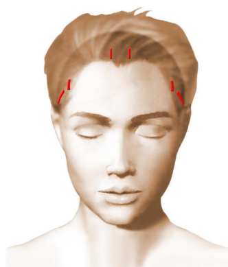
Incisions = cicatrices

Ces incisions permettent le passage de l'endoscope relié à une mini caméra-vidéo et livrent passage aux différents instruments spécifiquement adaptés à cette chirurgie endoscopique.